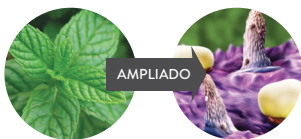
Bolsa de Óleo da folha de Hortelã-pimenta